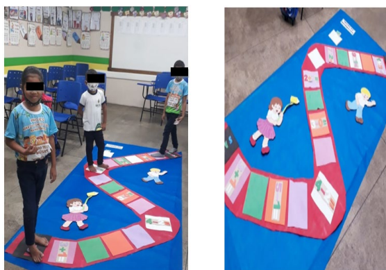
Figura 1 - Projeto lúdico do letramento em sala de aula.

O conceito de Alfabetização e Letramento. Referenciamo-nos a Soares (1998) para fazer a descrição desses dois elementos: quando nos referimos à alfabetização estamos indicando a aprendizagem e o domínio do código alfabético, ou seja, o estudante aprendeu a decodificar o código, e, com ele, a tecnologia da escrita, possui domínio sobre a escrita alfabética e habilidades para utilizá-la na leitura e na escrita.