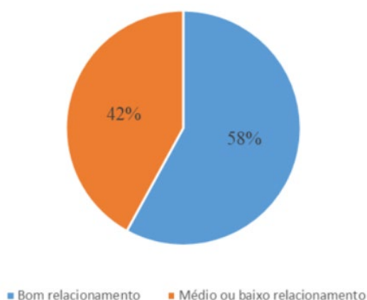
Gráfico 2 - Percentual de propensão a produtos dos respondentes

Para a análise de dados obtidos no questionário foi levado em consideração o índice de propensão a produtos que é o atual método utilizado pela cooperativa para medir o quando o cooperado está se relacionando com a mesma. Este atual modelo usa como base um total de 23 produtos que podem ser utilizados pelos cooperados e considera-se que o cooperado tem um bom relacionamento, caso ele possua 08 ou mais produtos vinculados a sua matrícula, conforme dados informados pela cooperativa. O gráfico abaixo ilustra a propensão de produtos dos cooperados respondentes em percentual de relacionamento bom ou médio/baixo. Já o quadro aborda as respostas pelas quantidades de respondentes.