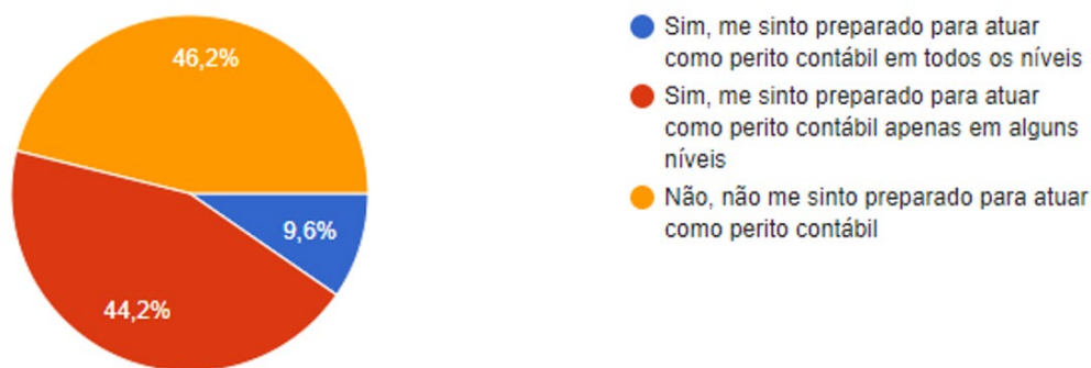
Gráfico 1 – Relação do conteúdo ministrado na graduação x Necessidade para atuar profissionalmente.