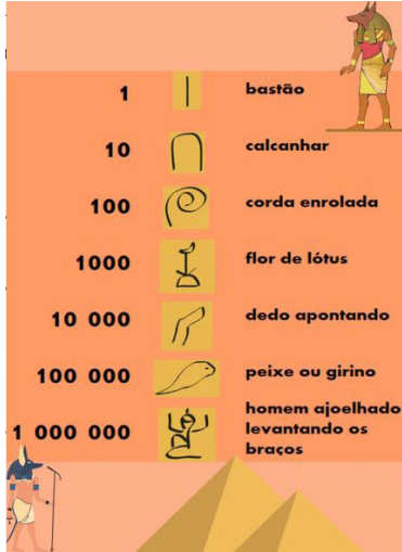
Figura 2 - Símbolos chaves da escrita egípcia.

Os povos egípcios desenvolveram um sistema de numeração composto por sete símbolos-chave, não posicional, e possuindo agrupamentos na base 10. Na figura 2, a seguir, têm-se os sete símbolos-chave usados pelos egípcios.