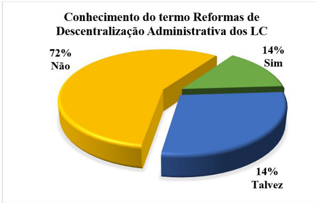
Gráfico 2 - Conhecimento do termo Reformas de Descentralização Administrativa dos LC.