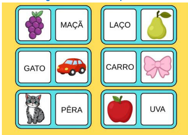
Figura 1 - Dominó das palavras.