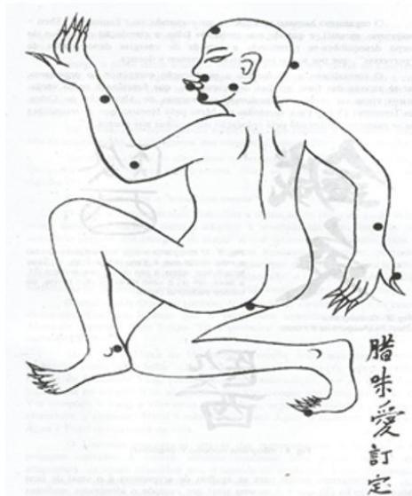
Figura 1 - Os Treze pontos do Demônio.