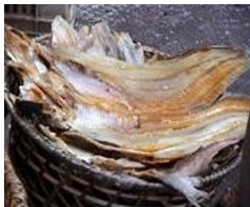
Figura 2 - (a) Peixe seco utilizado na culinária maranhense e (b) juçara.

O peixe seco bastante utilizado com juçara pela população ludovicenses (Figura 2) segue a técnica da salga seca que é o modo mais simples de curar o pescado. Faz-se o empilhamento de camadas alternadas de sal e pescado. A água que escoar é extraída do sistema. É uma técnica muito usada para pescados magros, os quais geralmente são descabeçados, eviscerados e cortados ventralmente. Se a altura do filé for muito grande, é conveniente fazer pequenos cortes. A proporção de sal usada é de 25-30% em relação ao peso do filé. Logo após, é colocado na secagem que tem por objetivo remover a água dos alimentos, diminuindo a atividade da água, impedindo o crescimento bacteriano e conseqüente decomposição. Normalmente o peixe é submetido à secagem ao ar livre, que depende das condições climáticas do meio ambiente: temperatura ambiente, sol, velocidade do vento e UR (Umidade Relativa) do ar. Portanto, o mecanismo de salga do peixe constitui-se um processo químico que inclui mecanismos que permitem a conservação desse alimento, possibilitado pelo processo de osmose (Vicenze, 2008).