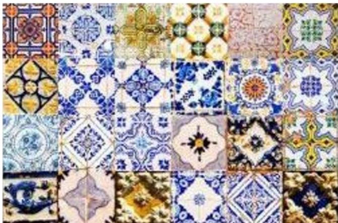
Figura 1 – Algumas molduras de azulejos encontrados na cidade de São Luís.