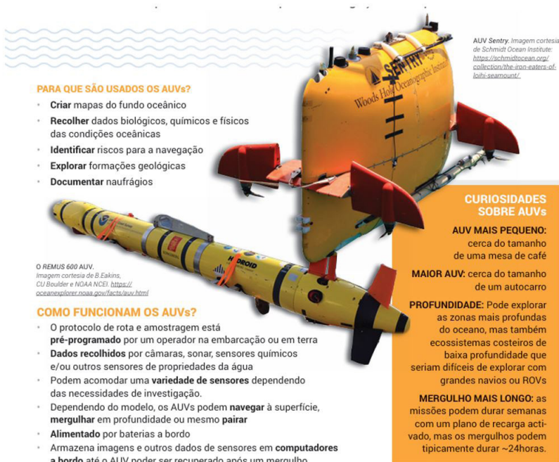
Figura 1 - AUV ficha técnica - Ocean exploration.

O problema central é que o modelo 100% manual não cabe mais no orçamento do mercado atual. A saída é dar mais autonomia aos robôs através de sistemas de navegação precisos e, posteriormente, da integração de inteligência artificial. Isso pode reduzir o tempo das missões em até 30%, tornando a exploração em águas ultraprofundas mais rápida e segura. Atualmente, temos AUVs no mercado offshore; não são operados por “AI”, porém são programáveis utilizando a integração de INS + DVL + GPS acústico. Após a programação, é iniciado o mapeamento do leito marinho, quando termina, o mesmo retorna à superfície e emite um sinal de localização.