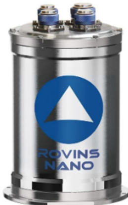
Figura 5 - Sistema de Navegação Inercial (INS) Rovins Nano da ixBlue.