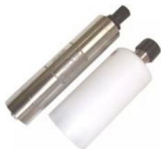
Figura 9 - Paroscientific Digiquartz® Series 8000: Submersible Depth Sensors.