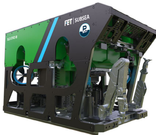
Figura 2 - Remotely Operated Vehicles - ROVs - Forum Energy Technologies, Inc.2026.