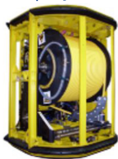
Figura 11 - Top-Hat Type V - Sistema de Gerenciamento de Tether (TMS) utilizado para desacoplar os movimentos da embarcação e otimizar o raio de operação do ROV.