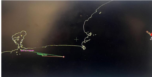
Figura 6 - Software NaviPac Pro - 2D.