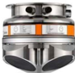
Figura 8 - Syrinx DVL 4k.