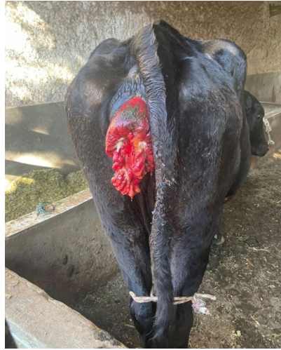
Figura 2 - Vaca com prolapso vaginal.