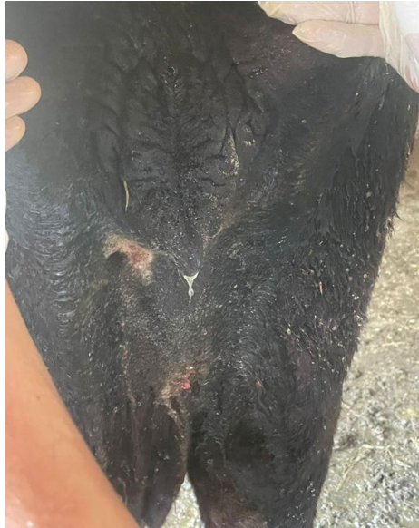
Figura 3 - Pós- imediato após realização do ponto em U.